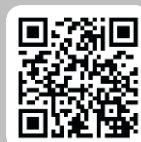
スマホやパソコン