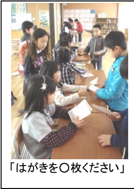
「はがきを〇枚ください」

普段、何気なく生活している子どもたちが、仕事の仕組みを知ったり、その仕事をする人になりきって工夫したりする活動は、自分も社会の中で役立つ人になるためのキャリア教育となります。2年生の郵便配達が楽しみです。