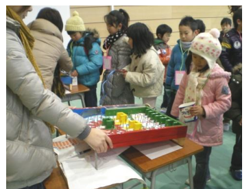
昨年の東山ランドの様子