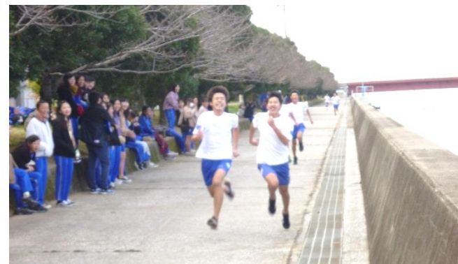
ゴール前 ラストスパートの接戦