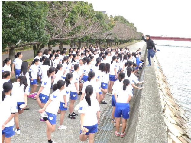
スタート前 準備運動