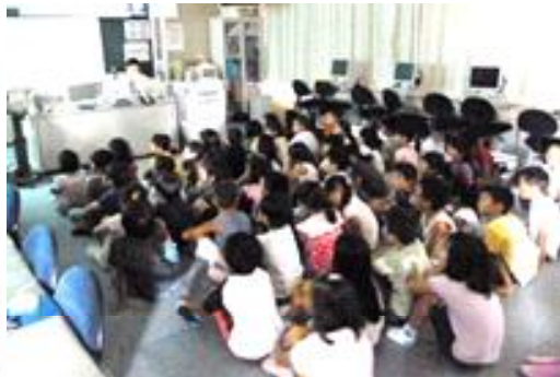
1年「かわいそうなぞう」