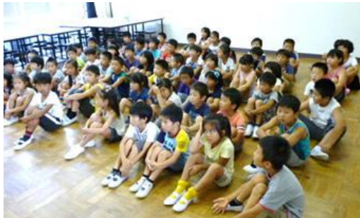
2年「とびうおのぼうやはびょうきです」