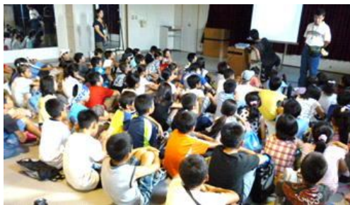
5年「夏服の少女たち」