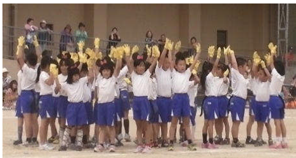
低学年「心をひとつにしてフィニシュ!」

高学年を中心にして、みんなが心をひとつにあわせて、運動会を成功させました。応援ありがとうございました。