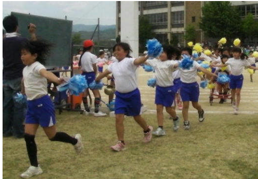
中学年「やり終えたあとの笑顔」