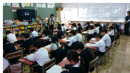
放送の合図で一斉に始めます、1年から6年まで集中しています！