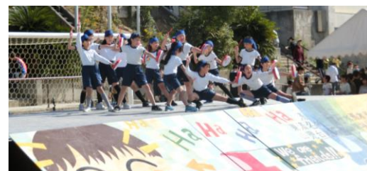
三中フェスタでの5年生有志のエイサー

当日は子どもたちで会場がいっぱいのため保護者の入場はできません。2日後の日曜参観で発表しますので、ぜひ参観の日に聴いてください。