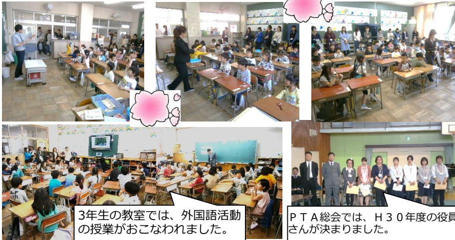
3年生の教室では、外国語活動の授業がおこなわれました。

4月20日(金)今年度はじめての授業参観でした。1年生にとってはじめての学習参観です。4月はじめは、少し緊張している様子でしたが、手を挙げてしっかり発表できるようになってきています。