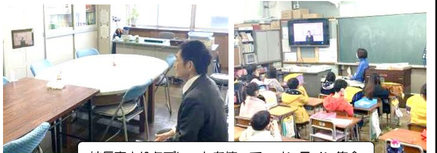
校長室よりタブレットを使って、オンライン集会