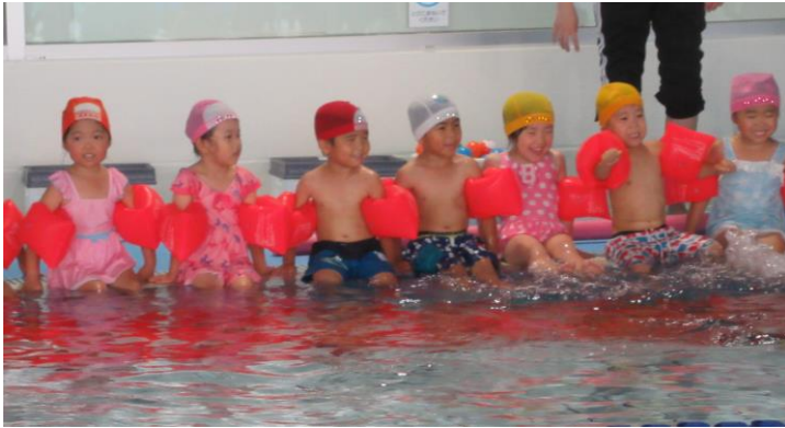
プール指導で お水と仲良し！