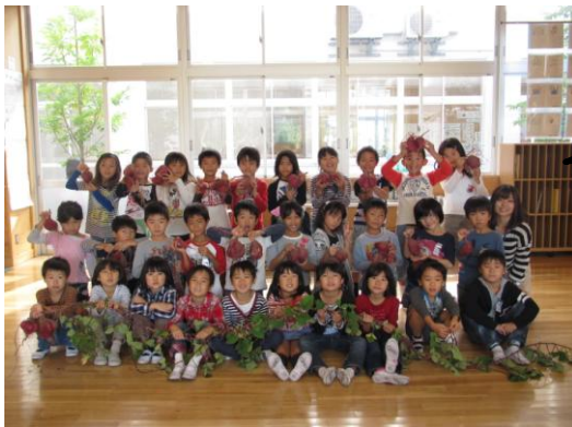
2年1組のおいもたち