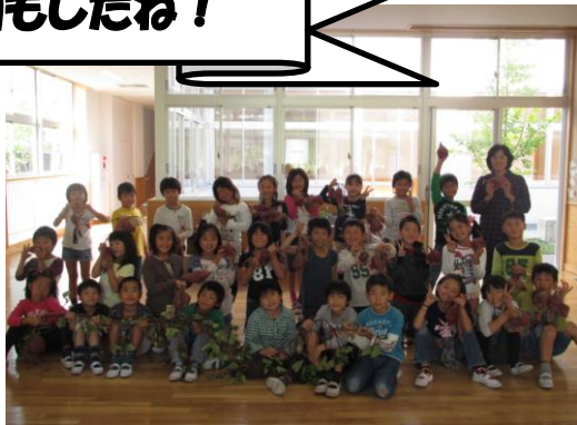
2年2組のおいもたち