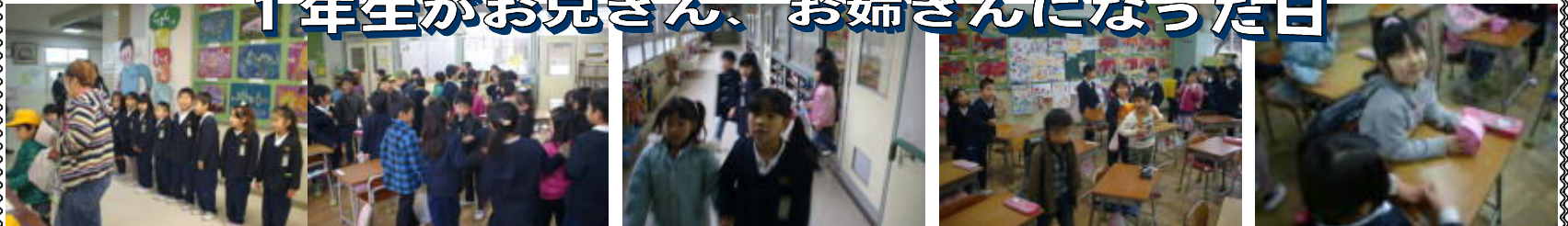
↑お出迎えして ↑自己紹介しよう ↑学校案内 ↑ランドセル体験 ↑手作りのプレゼント