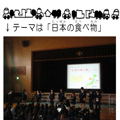
↓ テーマは「日本の食べ物」