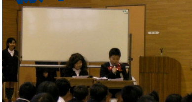
↑ 「シャツを出したままはだらしありませんね」