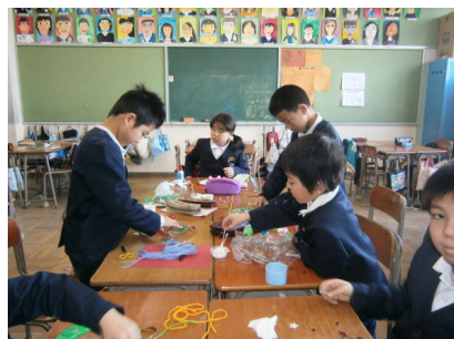
↑ 「いいのができそうだね。」