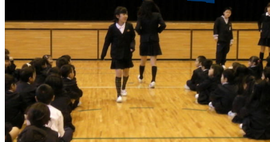
↑ 歩き方も上手です

12月の児童集会(ほぼ毎月曜日の朝に行っています)で、生活委員会の子どもたちが中心になって、標準服のファッションショーを行いました。審査員とモデルは生活委員会が、観客は全校のみんなです。