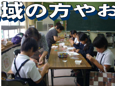
「小物作り」ふれあいルーム