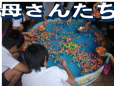
スーパーボールすくい「PTA」