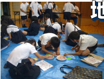
「アイロンビーズ」地域