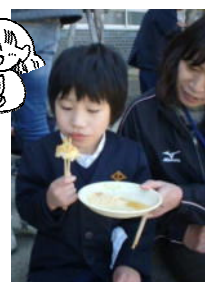
「きな粉餅おいしいな」