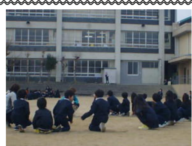
↑ 結果発表「ドキ・ドキ・ドキ…」

2/7~2/10の4日間は、大なわ週間でした。Eタイムなどでおなじみの縦割りグループで、14日の大なわ大会に向けて20分休憩に練習します。練習の最後には代表委員の合図で、3分間でとべる回数を数えます。何回とべるか、各グループみんなで「1、2……90…」と、大きな声で数えます。その日にとべた回数は、掲示板の表に記録されます。