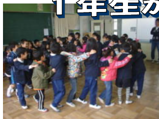
↑ 「貨物列車シュッシュ」

2月15日、来年度新1年生の体験入学を行いました。玄関で受付を済ませた新1年生を、1年生が教室までエスコートしました。学校を案内し、教室では色々なゲームを一緒にしました。ランドセルの背負い方まで教えてあげました。