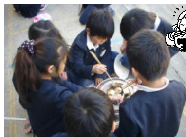
こげないように！ こげないように！