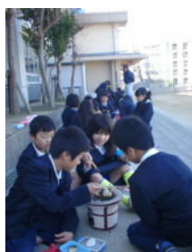
七輪の火を見ます

七輪の炭に火をつけ、火をおこしました。炭の火をおこすのはとても難しく、火の調整も大変でした。火が強すぎて餅をこがしてしまいました。でも、みんなで焼いて食べた餅は最高においしかったです。