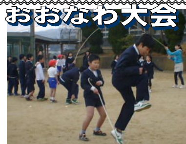
↑ なわは先生が回してくれます