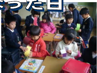
↑ 小さなランドセルの中には？

そして、そのランドセルの中には…！？なんと、1年生の手作りの小さなランドセルが入っていました。そしてそして、その小さなランドセルの中には…？。この日は、1年生が、たのもしなお兄さん、お姉さんになった日でした。