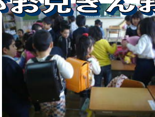
↑ 「ランドセルはね、こうやって…」