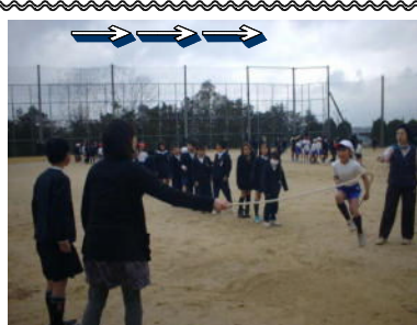
↑ 「さあ がんばるぞ！」