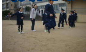
↑ 大なわ週間での練習とべた回数表