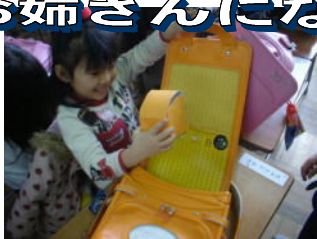
↑ ランドセルの中にランドセルが