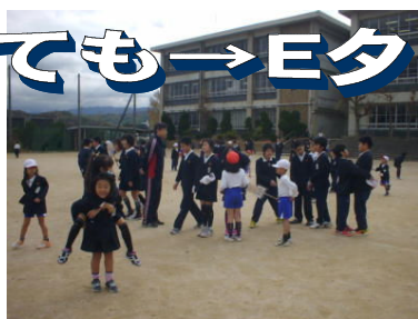
↑ そろそろ始めよう