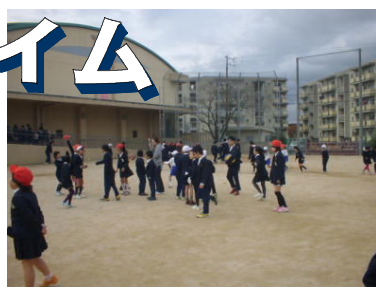
↑ 「お兄ちゃんは上手だな」

12月7日(火)20分休憩にEタイム(縦割りグループによる遊び活動)を行いました。10のグループに分かれ遊びます。1つのグループは1年から6年までがいる縦割りグループです。毎月1回、グループ毎に遊びを決めて取り組んでいます。高学年が低学年の面倒をみてあげるなど、微笑ましい場面が見られます。