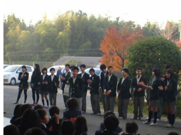
↑ 「待ってるよ！」生徒会の先輩