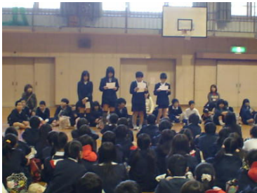
↑ 永寿小学校の紹介をする

12月2日(木)6年生が四中体験入学へ行きました。早めに中学校に着き、中学校で一緒になる南小学校と体育館でお互いに学校紹介をしました。その後弁当を食べ、体験入学の時間を待ちました。オープニングは、四中の生徒会から学校を紹介する楽しいパフォーマンスと、スライドやビデオを使った学校生活の紹介をしてもらいました。「四中って、いいなあ。」と、リラックスできた後、教室で実際に中学校の先生に授業をしていただき、体験授業を受けました。本校の6年生は、美術の授業でした。授業が終わったらクラブ見学をさせてもらい、クラブ体験もさせてもらいました。今年入学する中学校のことがよく分かってよかったと思います。最後は、この日お世話になった四中の生徒会の皆さんが、玄関の所まで見送りに来てくれました。お世話下さった四中のみなさん、先生方に感謝の一日でした。