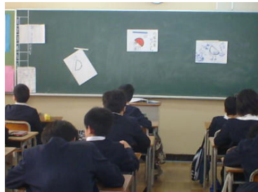
↑ 美術の授業を受ける