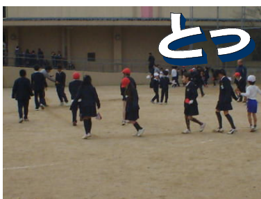
↑ みんなでコートをかいて