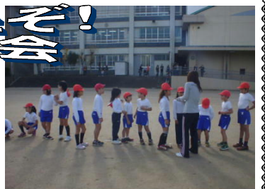
↑ 「ゴールした順番に並んでね」