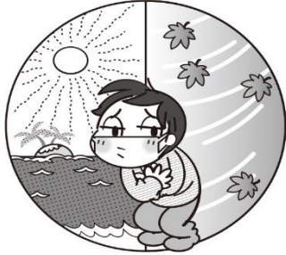
季節の変わり目 カゼに注意

かいづかしりつちゅうおうしょうがっこう ほけんしつ 貝塚市立中央小学校 保健室 2018.11