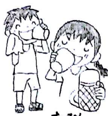
こまめに水分をとる