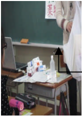
ふだんは沢山の薬を扱っています