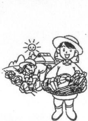
農作物を作っている人

私たちが毎日ごはんを食べることができるのは、食べ物を育てたり、運んだり、調理してくれる人のおかげです。「いただきます」「ごちそうさま」のあいさつをして感謝の気持ちをもっていただきましょう。