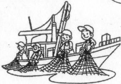
漁業をしている人