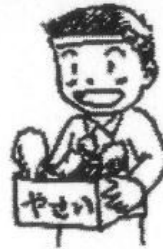
食べ物をお店で売っている人