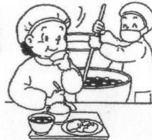
給食を調理している人