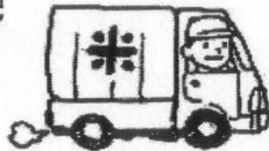
食べ物を運んでいる人