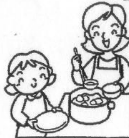
みんなのごはんを作っているおうちの人