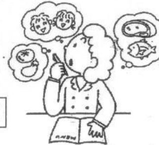
給食の献立をたてている人