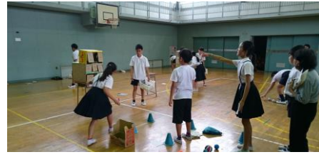
体育館で招待した方々と一緒に

木島っ子まつり 二十一日(金)午前中は、木島っ子まつりを全校で行いました。2~6年生は、クラスで考えたみんなが楽しめる企画を準備、計画して運営します。一年生は、この日招待した幼稚園やこども園のお友達を案内して楽しんでもらいました。ボランティア委員会では、近隣の高齢者福祉施設の方々を招待し、案内しました。 お金はかけずにごみもできるだけ出さず、みんなに優しい手作りの子どもたちのお祭りです。今まではなかったアイデアや工夫もいっぱい、説明や案内もよく考えてできていました。ごみもとても少なくなっていました。それぞれの活躍をまたおうちでも聞いてあげてください。