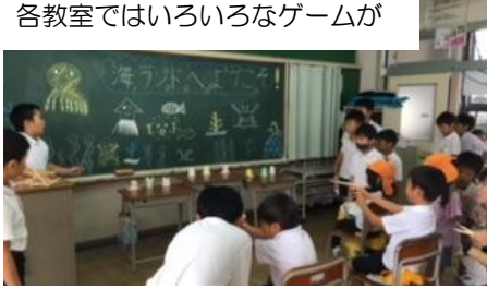
各教室ではいろいろなゲームが