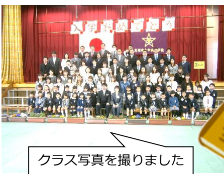
クラス写真を撮りました