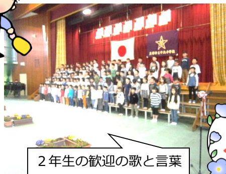
2年生の歓迎の歌と言葉