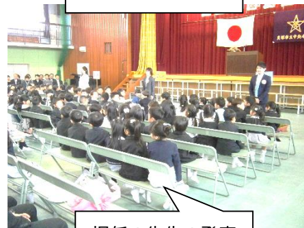
担任の先生の発表