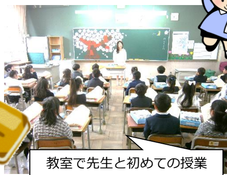
教室で先生と初めての授業