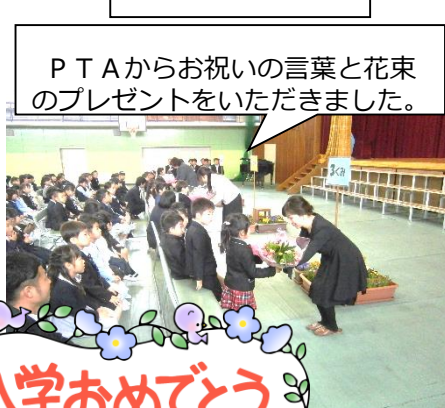
P T Aからお祝いの言葉と花束のプレゼントをいただきました。