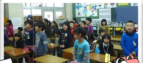
新1年生に詩を聞いてもらったよ!