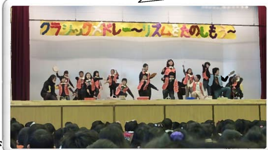
中央小学校での発表の様子

全校児童のみんなは、「知ってる!」「運動会の曲!」と手拍子をしたり、応援の拍手をしたりして、一緒に楽しんでいました。ひまわりのみんなのがんばりが伝わるすてきな発表会でした。2月2日(木)に予定していた「なかよし学習発表会」はインフルエンザ流行のため中止になりましたが、第二中学校・中央小学校・津田小学校・東小学校の4校のなかまたちと保護者の方が集まって、それぞれの発表を見せ合いました。