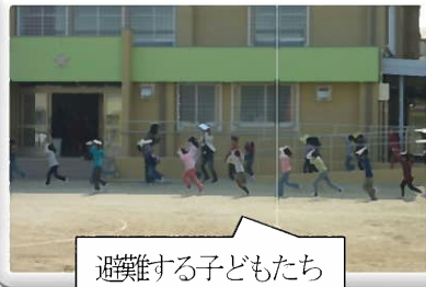
避難する子どもたち

本やノートで頭を守りながら運動場に避難した子どもたちはすばやく整列しました。避難する時は、「お」…「押さない」、「は」…「走らない」、「し」…「しゃべらない」、「も」…「もどらない」ことが大切なことや、もし海や川の近くで大きな地震があったときは、津波が起きるかもしれないので高いところに逃げることをみんなで確認しました。