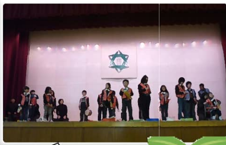
東小学校での発表の様子