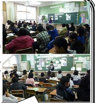
4・6年生でたばこの授業

あいにくの雨でしたが、5時限目には低学年、6時限目には高学年の学習参観がありました。たくさんの保護者の方々にご来校していただきました。ありがとうございました。