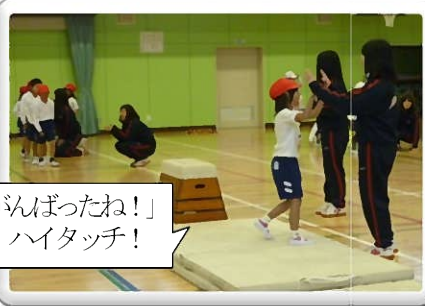
「がんばったね!」とハイタッチ!