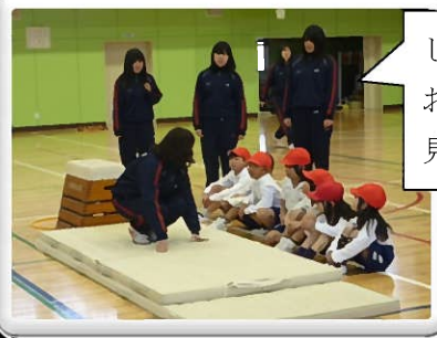
しっかりお手本を見てね!

1年生は7~8人ずつのグループに分かれ、それぞれのグループに4~5人お姉さんたちがついて、マットやフラフープを使ってジャンプの仕方や手のつき方、とび箱ののり方や降り方、そして跳び方を教えてもらいました。