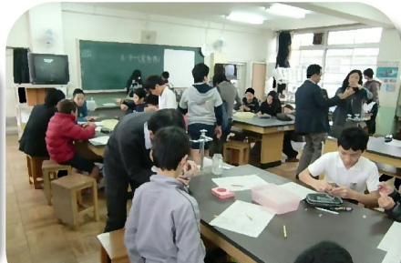
理科「モーター」を回そう！