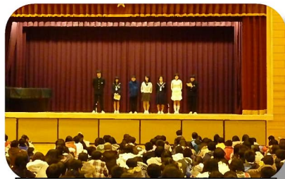
生徒会代表のみなさんより

授業もクラブ体験・紹介とも、いろいろと趣向を凝らした内容を準備してくださり、子どもたちは満足して帰って来ました。