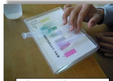
パックテストで 水質検査をしました。

環境については、水質テストを体験させてもらいました。大和川の水や池の水などを、水質検査薬(パックテスト)を使って実験しました。透明に見える水でも、日常の食べ残しや油、しょう油を流すと、川が汚れ自然に悪い影響を与えるということがよく分かりました。