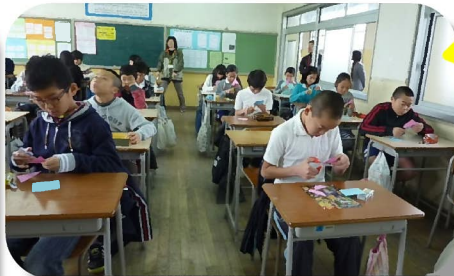
数学「図形パズル」に挑戦！