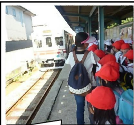
水間電車に乗って