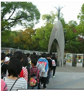
原爆の子の像の前で慰霊祭をしました