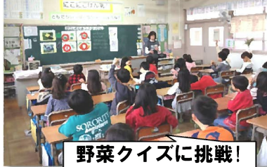
野菜クイズに挑戦!

農家の人たちが心を込めて作っている野菜をおうちの人や学校では給食室の人たちが料理してくれていることを教えてもらい、子どもたちは「これからは、残さずに食べたいです。」と発表していました。