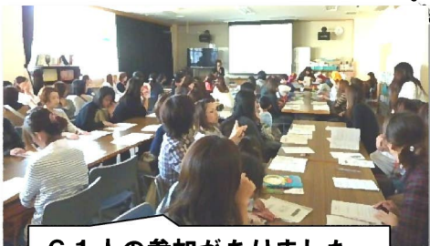
61人の参加がありました。