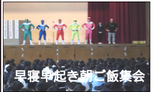
早寝早起朝ごはん集会