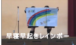
早寝早起きレインボー

11月17日(木)から24日(木)の5日間「早寝早起朝ごはん週間」のとりくみを行いました。朝の集会で南レンジャーから、早寝早起朝ごはんの大切さを教えてもらいました。子どもたちは毎朝、「早寝早起きすること