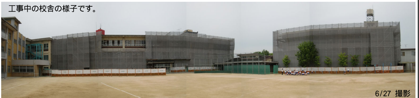
工事中の校舎の様子です。

今年、耐震補強工事のため、夏休み期間中は児童は登校できません。(なかよしホームは別扱いです)