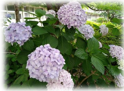
今は、アジサイが元気です。

先週の晴れ間に、中庭や玄関で春に咲いたチューリップの球根を掘り出しました。花が咲いていたのは3月の終わりごろでしたから、2カ月以上になります。花の終わったチューリップはだんだん葉っぱが枯れていくばかりで、学校の花壇としては見栄えが悪かったのですが、球根を太らせてたくておいていました。花の終わった後、葉っぱだけになってから一生懸命水を浴びて、太ってきた球根は、結構立派に大きくなっていたり、いくつも数を増やしていたり、しっかり成長していました。花が終わって誰も見向きもしない2カ月の間に、見た目は枯れていくだけに見えていたけれど、土の下では来年も花を咲かせるために、ひそかに成長していたわけです。来年、元気に花を咲かせてくれたらいいなと思います。