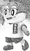
大阪府公立高校進学フェア もずやん