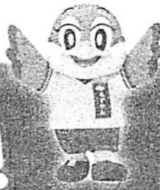
大阪府公立高校進学フェア もずやん