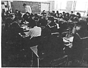
1組 数学 (1学期実施) 5組 数学