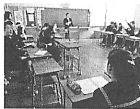
2組 国語 6組 総合