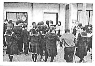
(伝える方も緊張しています)