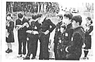
(資料をみながら学んでいます)