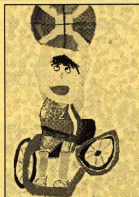
令和4年度小学生部門最優秀賞作品