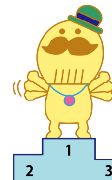
画：2-4 中司 杏実