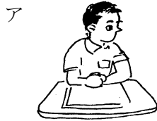
ア きょろきょろする