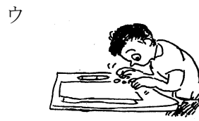
ウ 筆記用具などであそぶ