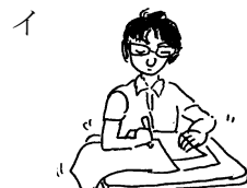
イ 解答用紙をずらす