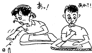
筆記用具等を落とした。